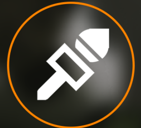
Interview Point de press sur Event