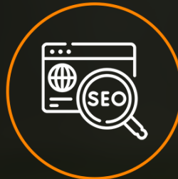
Référencement en ligne