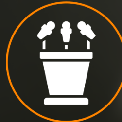
Conférence de presse