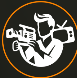
Médias & Tv

Nous vous proposons un angle de communication 360* degré afin de vous donner une visibilité globale et optimale.